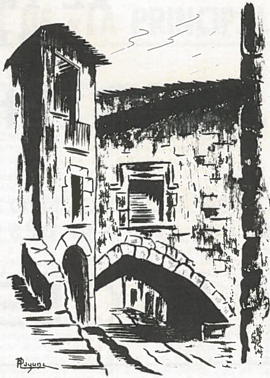
Apunt al natural d'un alumne de la Secció de Belles Arts, de la Societat "La Principal"

Un altre aspecte encuriós d'aquest poble, és que hi ha una gran quantitat de gossos i l'aclaració a la pregunta fou que hi ha també molts caçadors.