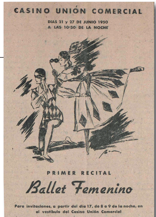
Dibuix de Manel Baró anunciant un ballet de l'Assumpta Trens el 1950