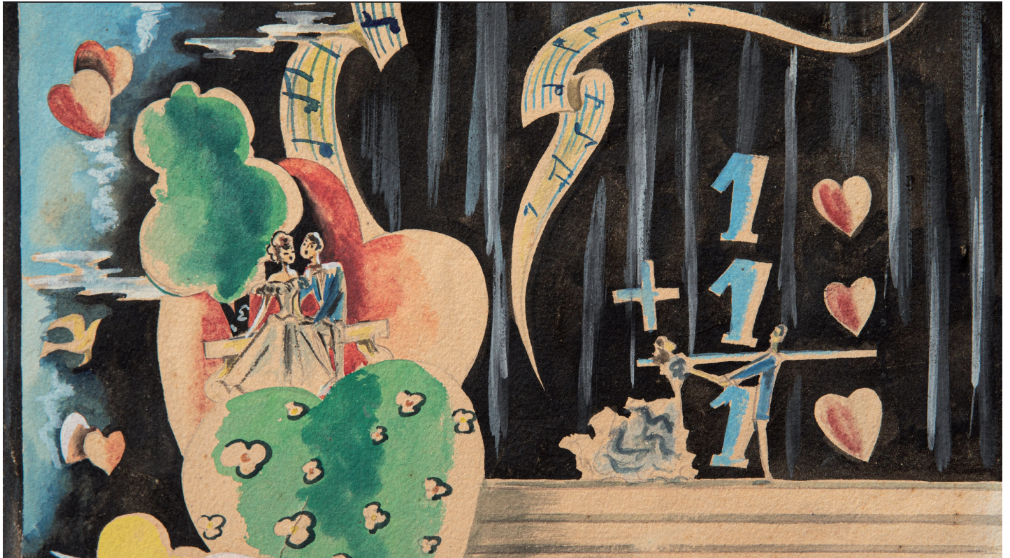
Decorat de Baró pel Follies TEC (2)

Baró projectava al teatre les fantasies dels musicals que tant li agradaven. L'impacte social d'aquest espectacle encara ara és recordat per molts vilatans. Va ser una alenada d'aire fresc, creativitat i alegria en una Vilafranca del 1950 que encara tenia cartilles de racionament i que vivia en un món cultural gris degut a la censura pròpia del règim franquista.